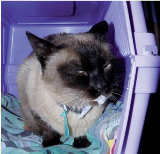
La salivación excesiva puede ser signo de estrés

Sin embargo, una vez que esta posibilidad queda descartada, el siguiente paso es buscar signos de estrés. Pregúntese: ¿Cuándo empezó el gato a comportarse de un modo distinto?. ¿Coincidió con algún suceso inusual